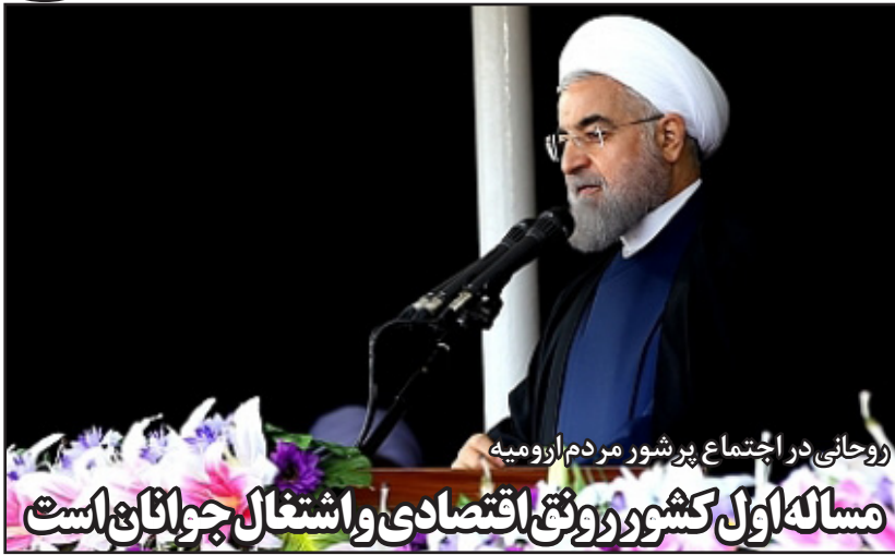
روحانی در اجتماع پرشور مردم ارومیه

وی همچنین درباره دستور عربستان برای استفاده زائران ایرانی از «مچ‌بند الکترونیکی»، توضیح داد: متأسفانه رسانه‌های ایرانی به موضوع دست‌بند، درست نپرداختند. خود سازمان حج استفاده از چنین دست‌بندی را به عنوان جایگزین کارت‌های PVC کرد در فاجعه منا مخدوش و شناسایی زائران را دشوار کرد پیشنهاد کرده بود، ولی مسأله آنجا بود که دولت عربستان صراحتاً اعلام کرد این مچ‌بندها را خودش طراحی می‌کند و به ایران اجازه نمی‌دهد طرح خود را اجرا کند.